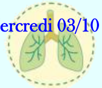
Schéma du corps humain Mercredi 03/10 Les 5 sens